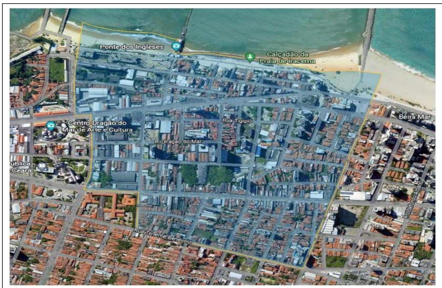
Imagem 01: definição das atividades por área a serem incentivadas